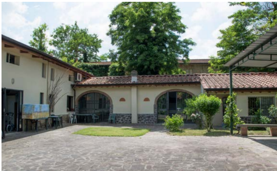
Centro diurno “Cinque Vie”, giardino esterno

Il centro di Firenze “Cinque Vie”, autorizzato per 40 posti, è immerso nella campagna limitrofa alla città. Si trova vicino al casello autostradale Al (Firenze Sud) da cui dista soltanto 5 minuti. E’ possibile raggiungerla anche con i servizi pubblici (ATAF, Fermata Cinque Vie 08).