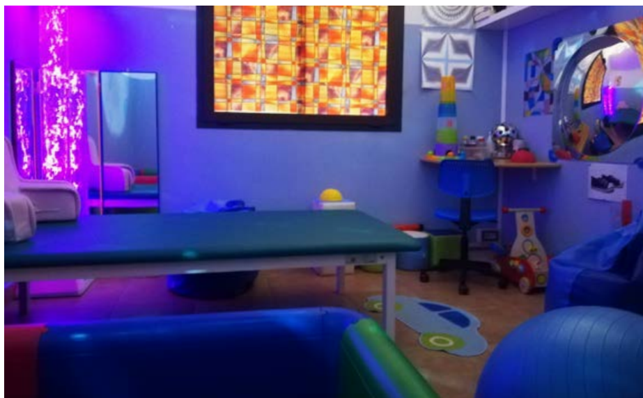
Stanza Snoezelen della residenza per minori "Il Fortino"

L'azienda si impegna a migliorare i livelli qualitativi delle prestazioni offerte considerando i reclami, i suggerimenti e le indicazioni buone opportunità di riflessione e crescita. A tal fine ci impegniamo a dare risposta ai reclami il prima possibile e comunque non oltre i trenta giorni dal loro ricevimento con evidenza delle azioni correttive intraprese.