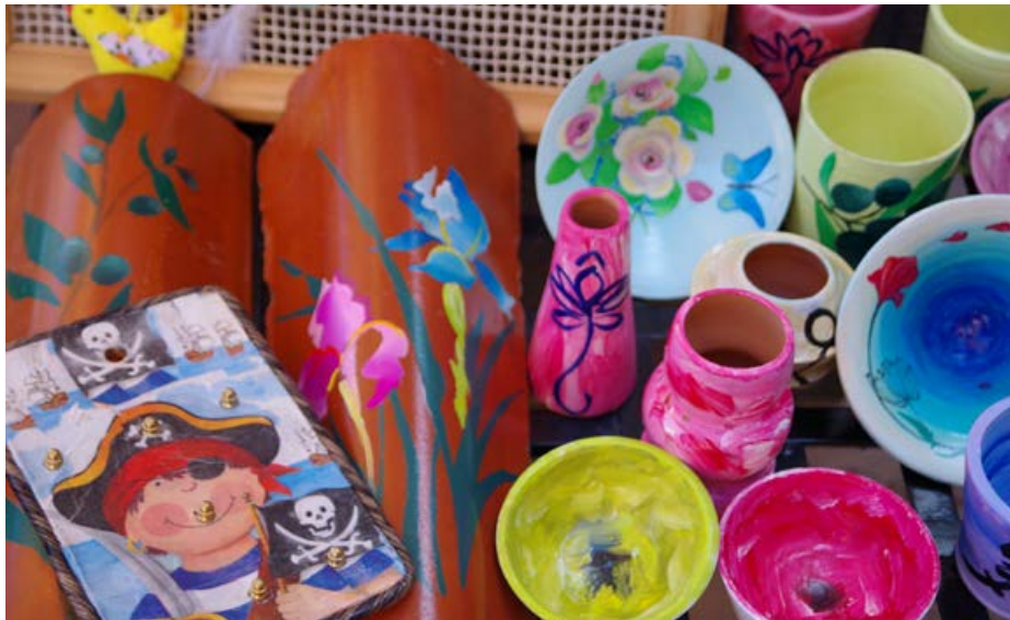
Artigianato e oggettistica realizzati nel laboratorio del centro