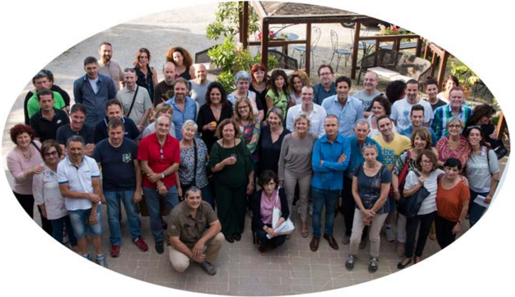
Una parte dello staff del CTE