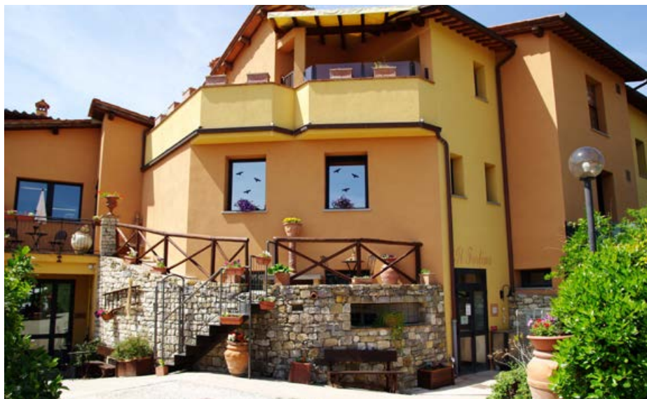
Residenza sanitaria per minori "Il Fortino"