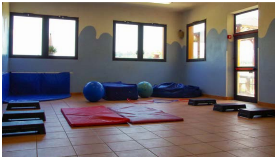
Palestra del Centro Diurno “Castello”