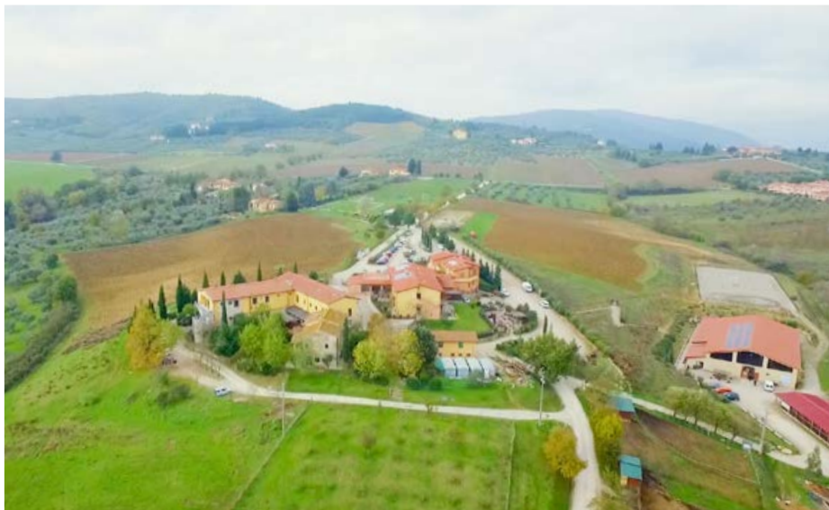
Sede amministrativa e strutture residenziali e diurna a Rignano sull'Arno con annesso maneggio, fattoria didattica e serra

di vita, cercando, per quanto possibile in una dimensione comunitaria, che ognuno mantenga le proprie abitudini e personalizzi gli ambienti in cui vive.