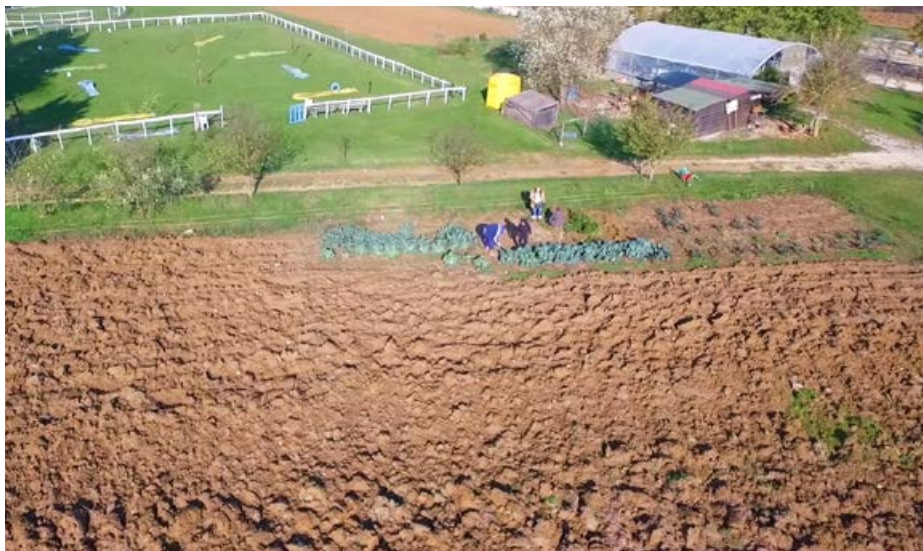
Attività all'aperto di ortoterapia, serra e spazi per le attività ricreative