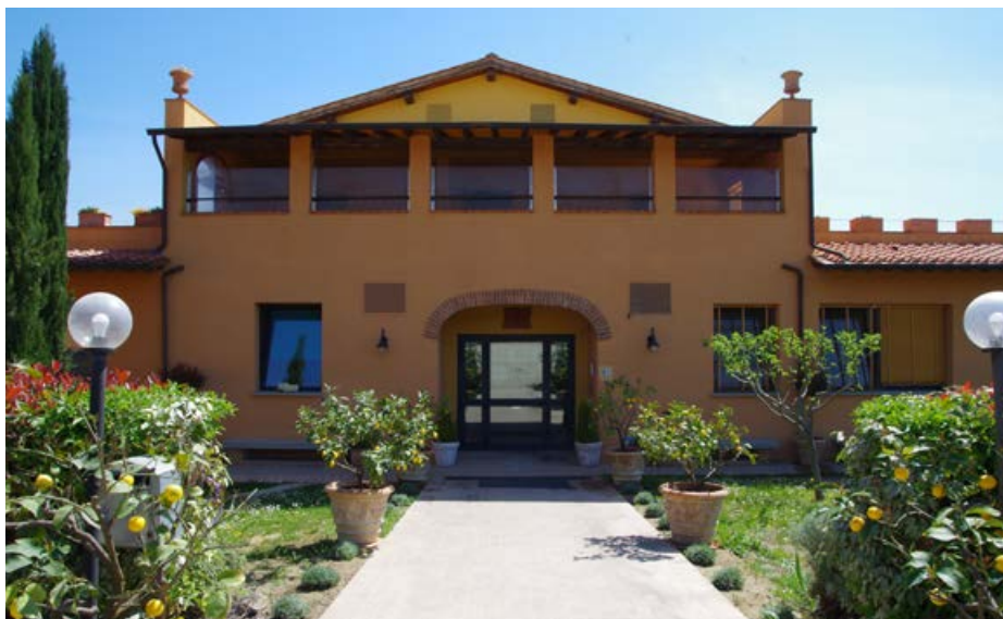
Centro diurno “Castello”

Il centro, nel comune di Rignano sull'Arno, autorizzato per 34 posti, è inserito in un contesto rurale nelle colline del Valdarno fiorentino. Il centro è adiacente alle strutture residenziali del CTE ed è raggiungibile preferibilmente in macchina (è altresì possibile raggiungerlo attraverso il sistema di trasporto pubblico da Pontassieve e Rignano sull'Arno). Si trova vicino all'uscita dell'autostrada A1 Incisa-Reggello.